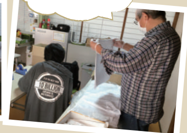
タオルたたみ作業