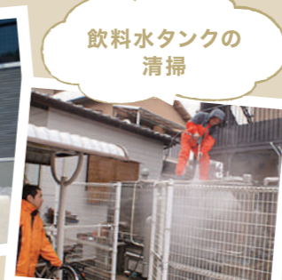
飲料水タンクの清掃