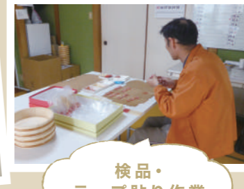
検品・テープ貼り作業